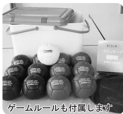
ゲームルールも付属します

7/13(木)に県の障害者スポーツ協会が主催するスポーツ教室が大館樹海体育館で開催され、小坂町からも7名の身体障害者協会員が参加しました。当日行われた競技種目はパラリンピックの正式種目にもなっているボッチャと卓球とバ