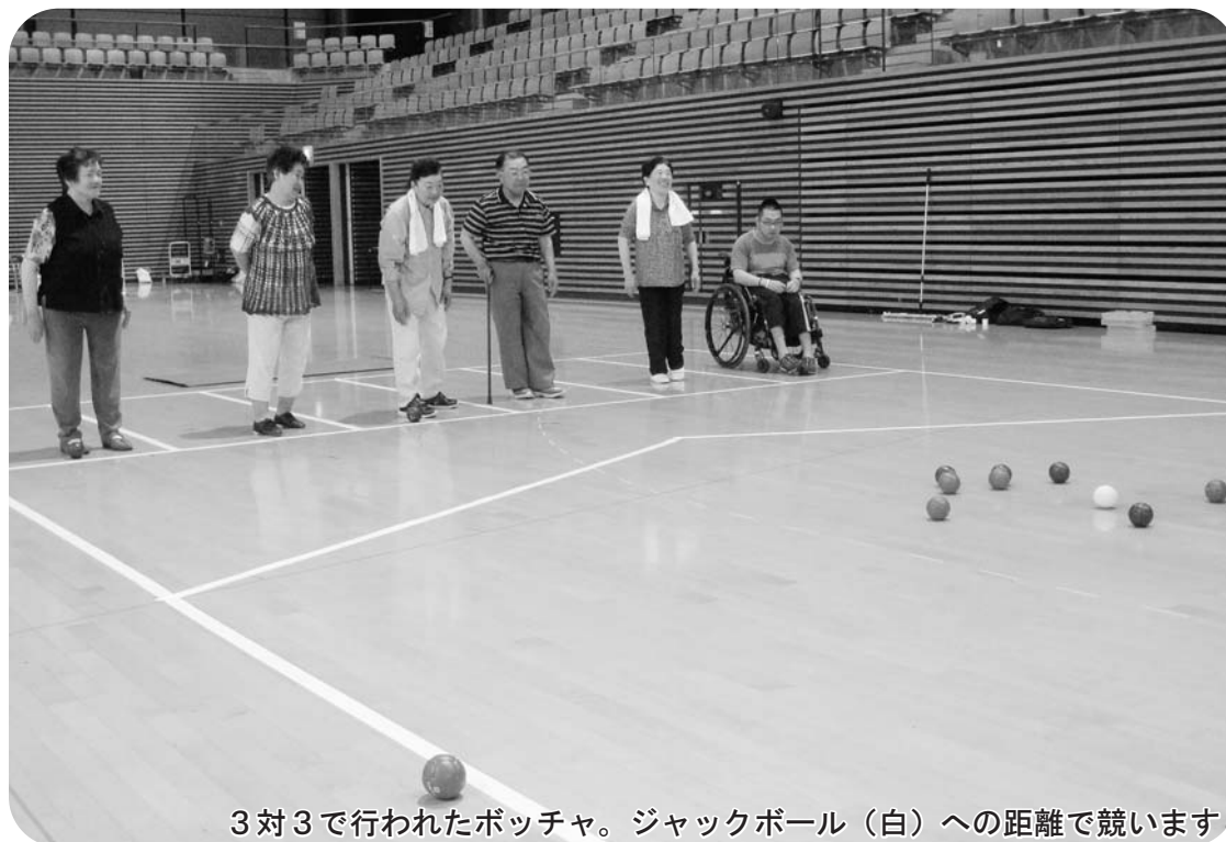
3対3で行われたボッチャ。ジャックボール(白)への距離で競います

〒017-0201 小坂町小坂字上前田7-1(ゆーとりあ内) TEL: 0186-29-3221 FAX: 0186-29-3218 URL: http://kosaka-syakyo.net/publics/index/