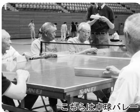
こちらは卓球バレー

7/13(木)に県の障害者スポーツ協会が主催するスポーツ教室が大館樹海体育館で開催され、小坂町からも7名の身体障害者協会員が参加しました。当日行われた競技種目はパラリンピックの正式種目にもなっているボッチャと卓球とバ