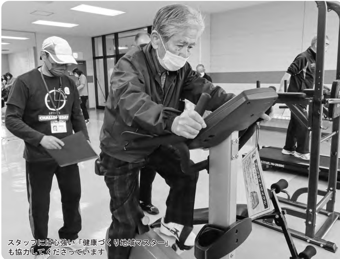
スタッフには心強い「健康づくり地域マスター」も協力してくださっています

〒017-0201 小坂町小坂字上前田7-1(ゆーとりあ内) TEL: 0186-29-3221 FAX: 0186-29-3218 URL: http://kosaka-syakyo.net/