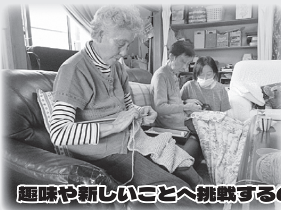
趣味や新しいことへ挑戦するのもいいですね