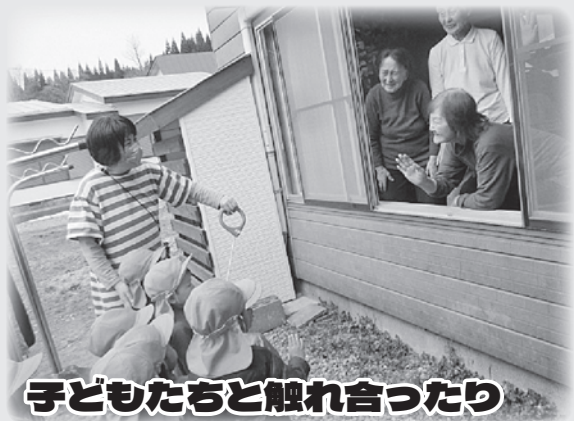
子どもたちと触れ合ったり