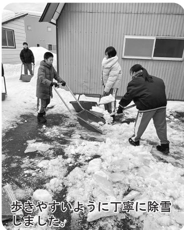
歩きやすいように丁寧に除雪しました。

今年の冬は例年になく積雪も多く、大変ご苦労された冬であったと思います。一昨年、小坂高校が統合され、小坂町での高校生除雪ボランティア活動が終了してしまいました。今年度は小坂町から鹿角高校へ通う生徒(2年生9名、1年生8名)が参加する事となり、復活する事ができました。1月28日に2年生と2月4日に1年生が消防小坂分署、小坂ふくし会、社協と一緒に活動をしました。さらに今年は積雪が多く、2月12日に県、役場、小坂ふくし会、社協で地域貢献活動の一環として実施し、2月16日は小坂中学校の全校生徒、先生による除雪活動も行い、延べ35件の除雪をしました。 寒さの中、慣れない作業を一生懸命行ってくれた中学生と高校生、除雪に課題を抱える方々の安全な暮らしを支えるために協力しあい、世代や職種を超えて一丸となって活動してくださいました。