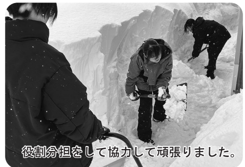
役割分担をして協力して頑張りました。