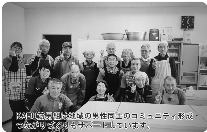
KABU筋男組は地域の男性同士のコミュニティ形成・つながりづくりもサポートしています。