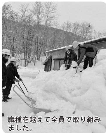
職種を超えて全員で取り組みました。