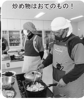
炒め物はおてのもの！