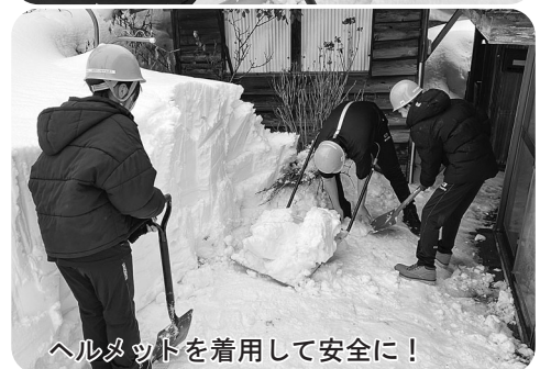
ヘルメットを着用して安全に!