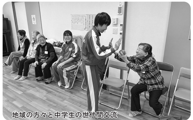
地域の方々と中学生の世代間交流

*****わたしたちはボランティアによる福祉のまちづくりを応援します。*****